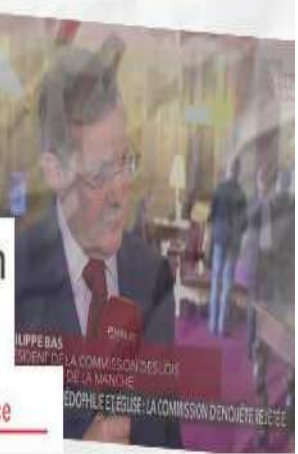
PHILIPPE BAS PRÉSIDENT DE LA COMMISSION D'ENQUÊTE DE LA MANCHE PÉDOPHILIE ET ÉGLISE - LA COMMISSION D'ENQUÊTE DE